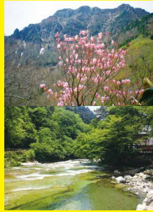
石鎚国定公園について

国定公園とは、国立公園に準ずる優れた自然の風景地であって、環境大臣が指定するものです。石鎚国定公園は、石鎚山を主峰とする石鎚山脈の一部を区域として、昭和30年11月1日に指定されました。総面積は10,683ha(愛媛県内分7,820ha)で、指定区域の大部分を愛媛県が占めますが、一部高知県も含まれています。石鎚山をはじめ、愛媛県の標高ベスト3である二ノ森、瓶ヶ森や伊予富士などの秀峰のほか、石鎚山の西麓にある景勝地 面河溪も同国定公園に含まれており、新緑、紅葉の名所となっています。